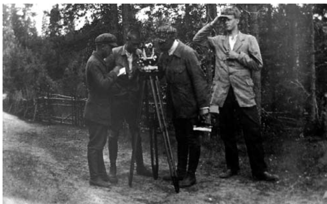
Artikkelin kuvat ovat kirjan kuvitusta.

suuden kasvuille ja kehittymiselle korostuu myös kirjan kautta. Myös 1600- ja 1700-lukujen kartat selityksineen nousevat korostetusti esiin ensimmäisinä 'paikkatiedon' tarjoajina. Etenkin 1700-luvun puolivälin merkitys korostuu, koska tuolloin tietoja alettiin kerätä järjestelmällisesti.